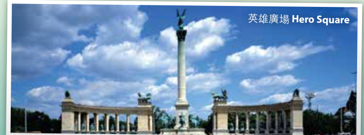
英雄廣場 Hero Square

Drive to Krakow, visit Krakow Square . Then view Renaissance Cloth Hall , and Mary's Church .