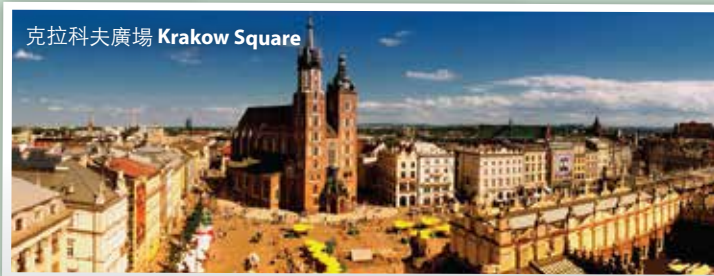
克拉科夫廣場 Krakow Square

前往布拉格，遊覽市內名勝，如[布拉格古堡]、有600多年歷史的哥特式教堂-[聖維特大教堂]、教堂南面的[總統府]以及對面的[聖佐治教堂]。Drive to Prague for a tour of the city: visit Prague Castle, St. Vitus Cathedral, Presidential Palace and St. George Church .