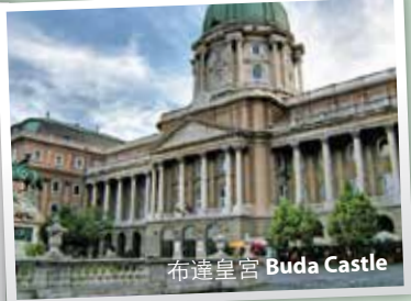
布達皇宮 Buda Castle