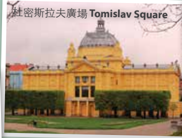
杜斯斯拉夫廣場 Tomislav Square

前往克羅地亞首都-薩格勒布。抵達後遊覽為紀念第一位克羅地亞國皇杜斯斯拉夫而建的廣場[杜斯斯拉夫廣場]，繼後前往克羅地亞最大宗教建築[聖母升天大教堂]、屋頂貼滿七彩馬賽克瓷磚的[聖馬可教堂]及供奉了古老聖母子畫像的[古石門]。Drive to Zagreb. Visit Tomislav Square , the Katedrala Marijina Uznesenja , St. Mark's Church and Stone Gate .