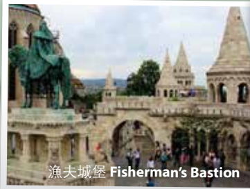
漁夫城堡 Fisherman's Bastion

前往遊覽世界上最大的溫泉湖-哈域斯，是匈牙利最有名之一的、世界認頂的溫泉度假中心。客人可自費前往享用[當地地道溫泉*]。繼後前往匈牙利的首都-布達佩斯，遊覽[漁夫城堡]，是欣賞布達佩斯和多瑙河最佳地點，這裡可以清楚觀賞對岸的國會大廈、多瑙河上的點點船隻與細長橋影。隨後前往[布達皇宮]、[英雄廣場]，參觀廣場中央的紀念柱，柱上有天使銅塑，塔下是匈牙利馬紮爾民族領袖和6位族長的騎馬像。Drive to Hevis where you can enjoy the local hotspring* (at your own expense). Then travel to Budapest, and visit Fisherman's Bastion and see the Hungarian Parliament Building and the Danube River. Later, visit Buda Castle and Hero Square .