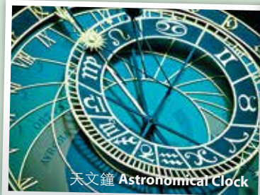
天文鐘 Astronomical Clock

酒店早餐後，遊覽[舊市政廳]，建於1388年的舊市政廳下看大型天文鐘報時是每位遊客的「指定節目」。這座15世紀初的天文鐘，朝5晚9每小時會跑出一群木偶報時，加上天文鐘本身美輪美奐的裝飾，令下面的遊客看得如癡如醉。之後參觀[約翰胡斯紀念像]及[查理斯橋]。隨後前往德國紐倫堡。Visit Prague old Town Hall, the Astronomical Clock, John Huth memorial Statue and Charles Bridge . Then drive to Nuremberg.