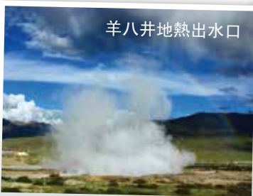
羊八井地熱出水口